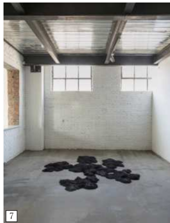
1. 蔡國強(ツァイ・グオチャン)《私はE.T.天神と会うためのプロジェクト:Project for Extraterrestrials No.4》福岡アジア美術館所蔵/2. 李洪波(リー・ホンポー)《無始無終》/3. 林延(リン・イェン)《天璣》/4. 劉建華(リュウ・ジャンファ)《白紙》/5. 王郁洋(ワン・ユウヤン)《語る -- 紙の束》/6. 鄒建安(ウー・ケンアン)《五百筆・半天云》/7. 伍偉(ウー・ウェイ)《ステルス》