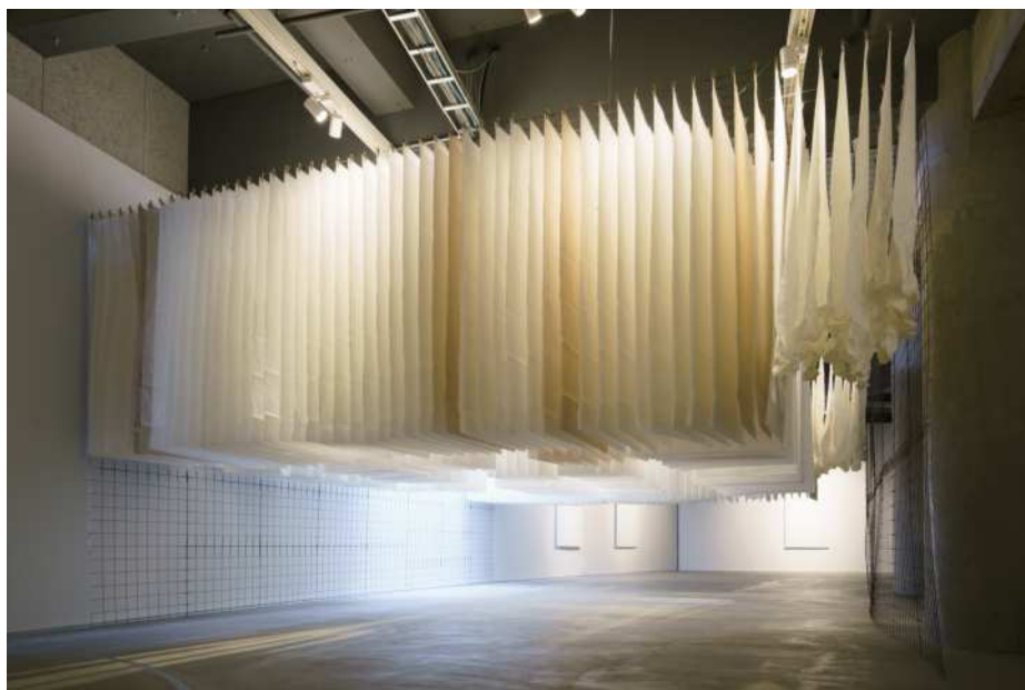
展示風景：林延（リン・イェン）《天璣III一問天》