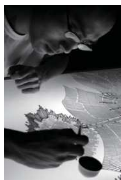
鄢建安 (ウー・ケンアン)

1979年ハルビン生まれ、北京在住。新しいメディアを使って、創作しているにも関わらず、科学技術の新規性を強調しない作風で知られる。「時代遅れ」の技術、「破壊的」の美学、材料の浪費がもたらすアート性に関心を持ち、ユーモアとフィクションと奇抜さで人生を探索しながら体験と認知の関係を描く。本展では、「紙」は独立して存在するものとして自己認識を紙に与えた作品《語る一紙の束》を展示。手づくりの紙の生産過程を記録した映像を手作りの紙に印刷したその作品を通じて、観念と方法の転換を語る。※日本初展示