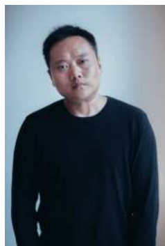
伍偉 (ウー・ウェイ)

1980年北京生まれ、同在住。強い創造性と豊かな思想性があり、新たな表現方法を模索しながら独自のスタイルで中国とヨーロッパの古代神話や歴史を学ぶ。伝統的な文様や書など中国の伝統文化をベースにエネルギッシュな現代アートへと昇華させた作品が評価され、ニューヨークのメトロポリタン美術館やヴェネチアビエンナーレ中国パビリオン等、国内外で作品を多数発表。本展では、2016年に越後妻有で多くの人々に筆を入れてもらい制作した作品《五百筆シリーズ》を通じて、個人と集団の関係性を考えるきっかけを与えます。