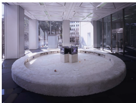
《都会生活者のためのオアシス》2010