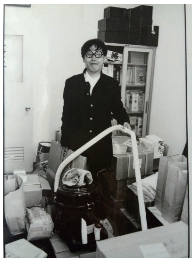
《不在と存在》1994