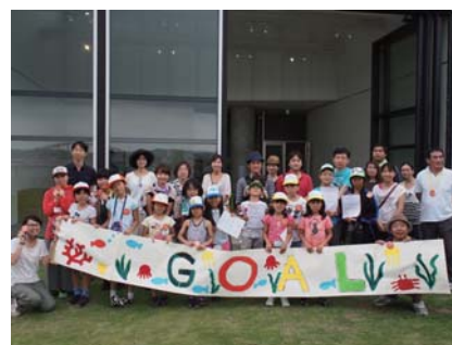
▲これまでの活動の様子